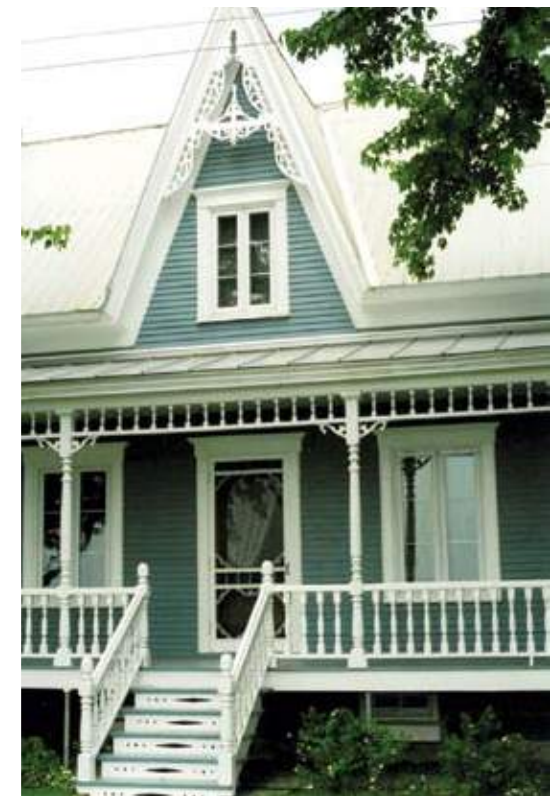
SAINT-HUGUES, 4 e RANG