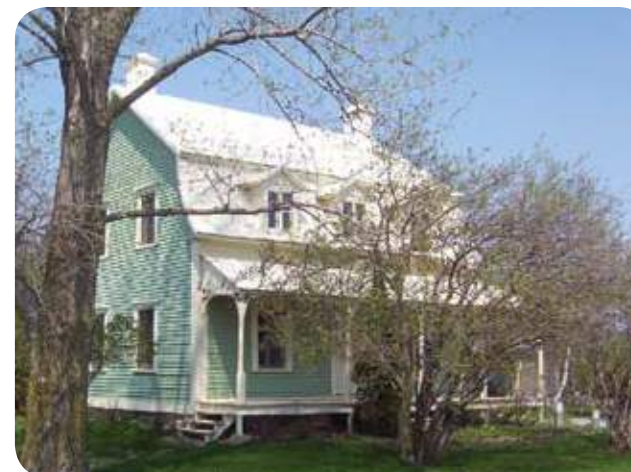
› SAINT-MARCEL-DE-RICHELIEU, RANG DE L'ÉGLISE

*** Prioritaire compte tenu de la quantité et de la qualité des artefacts (objets) et sources documentaires à mettre en valeur pour le bénéfice des citoyens et des visiteurs.