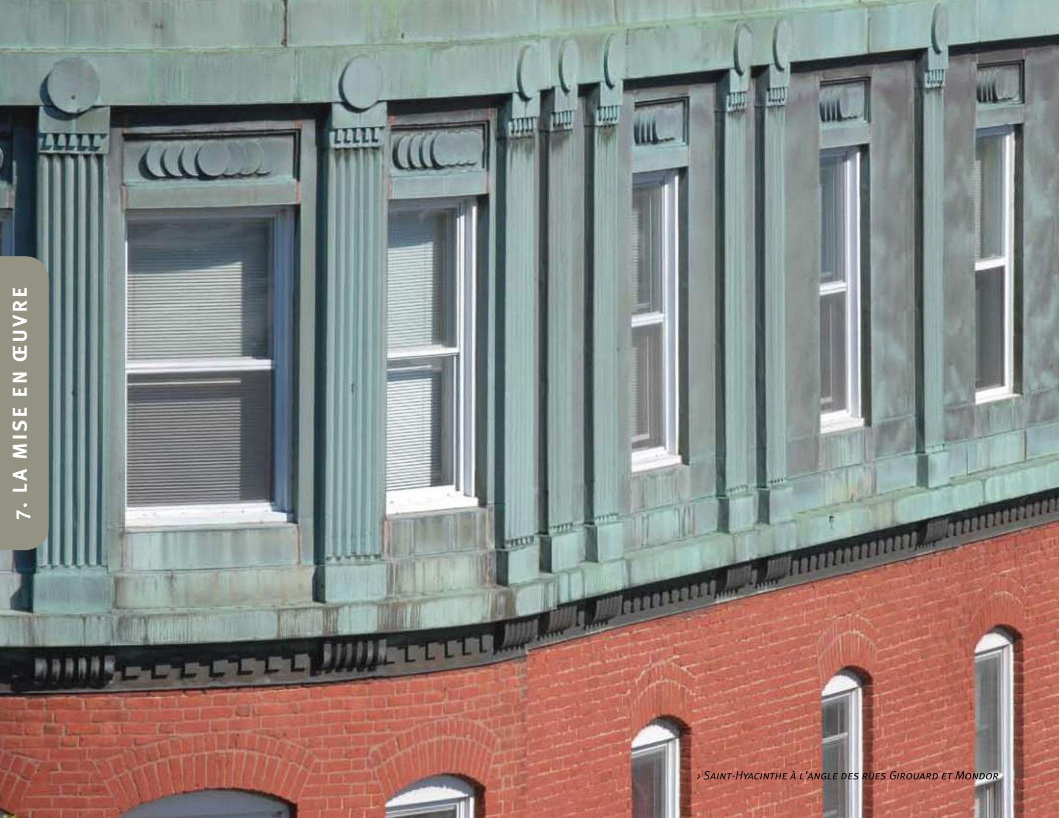
› SAINT-HYACINTHE À L'ANGLE DES RUES GIROUARD ET MONDOR