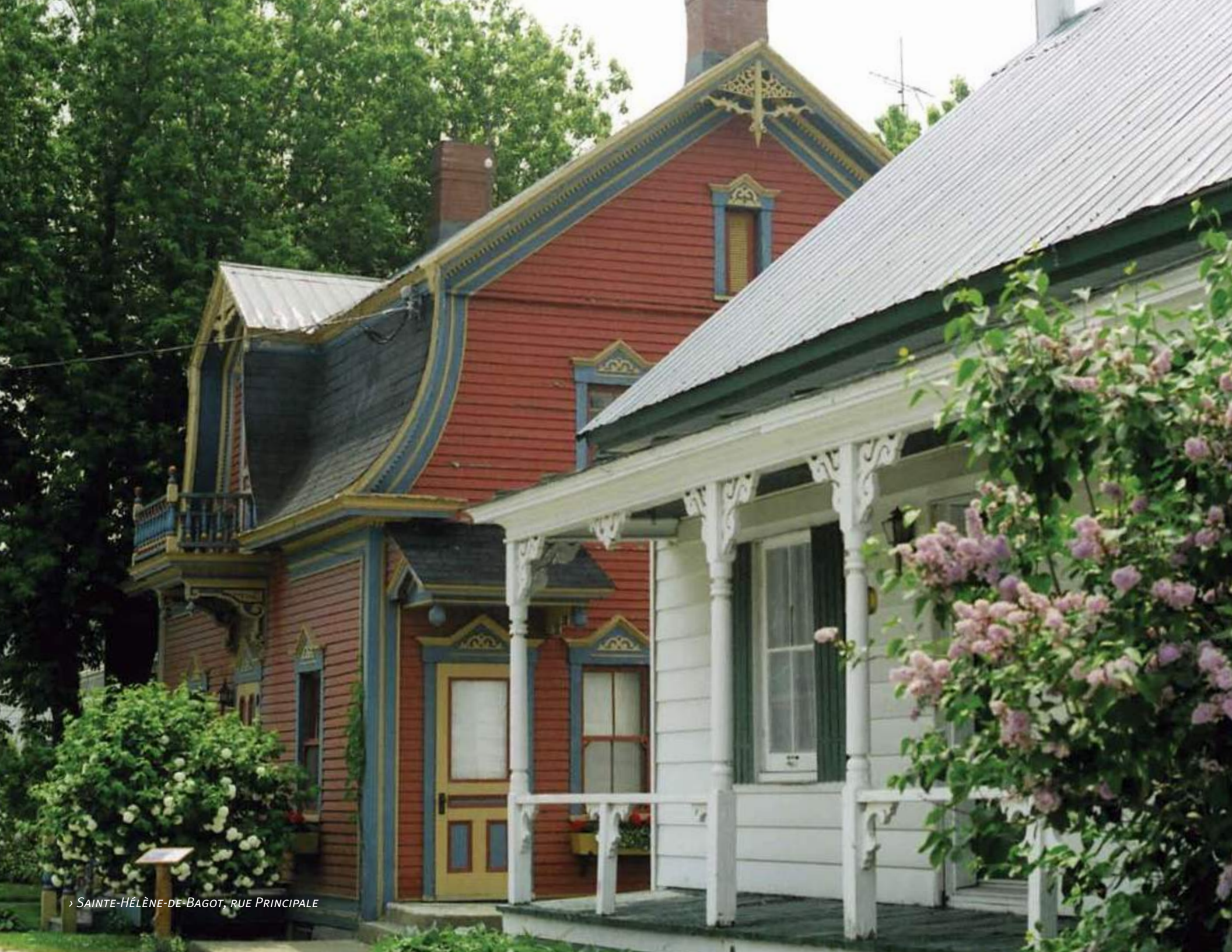
› SAINTE-HÉLÈNE-DE-BAGOT, RUE PRINCIPALE