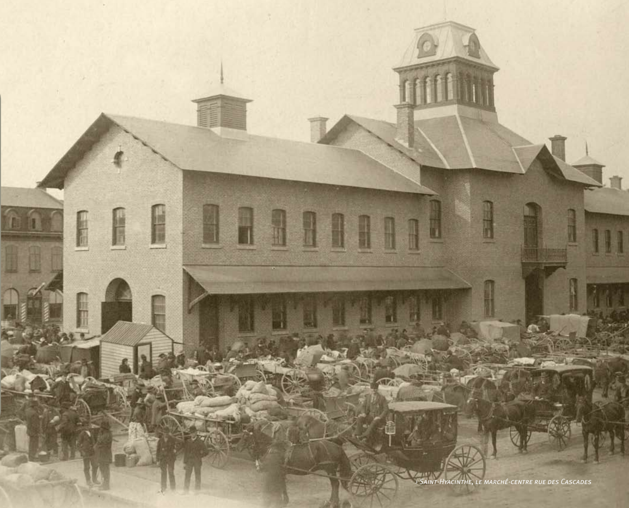
› SAINT-HYACINTHE, LE MARCHÉ-CENTRE RUE DES CASCADES