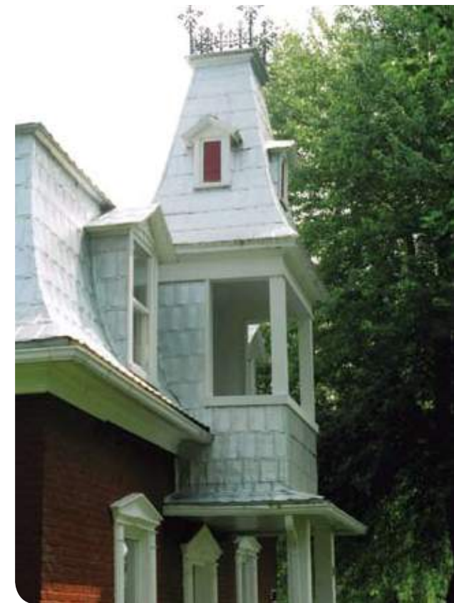
› SAINT-VALÉRIEN-DE-MILTON, CHEMIN DE SAINT-DOMINIQUE