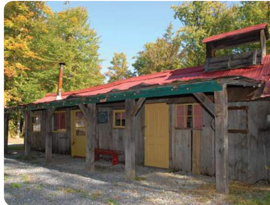
› SAINT-BERNARD-DE-MICHAUVILLE, CABANE À SUCRE, RANG FLEURY