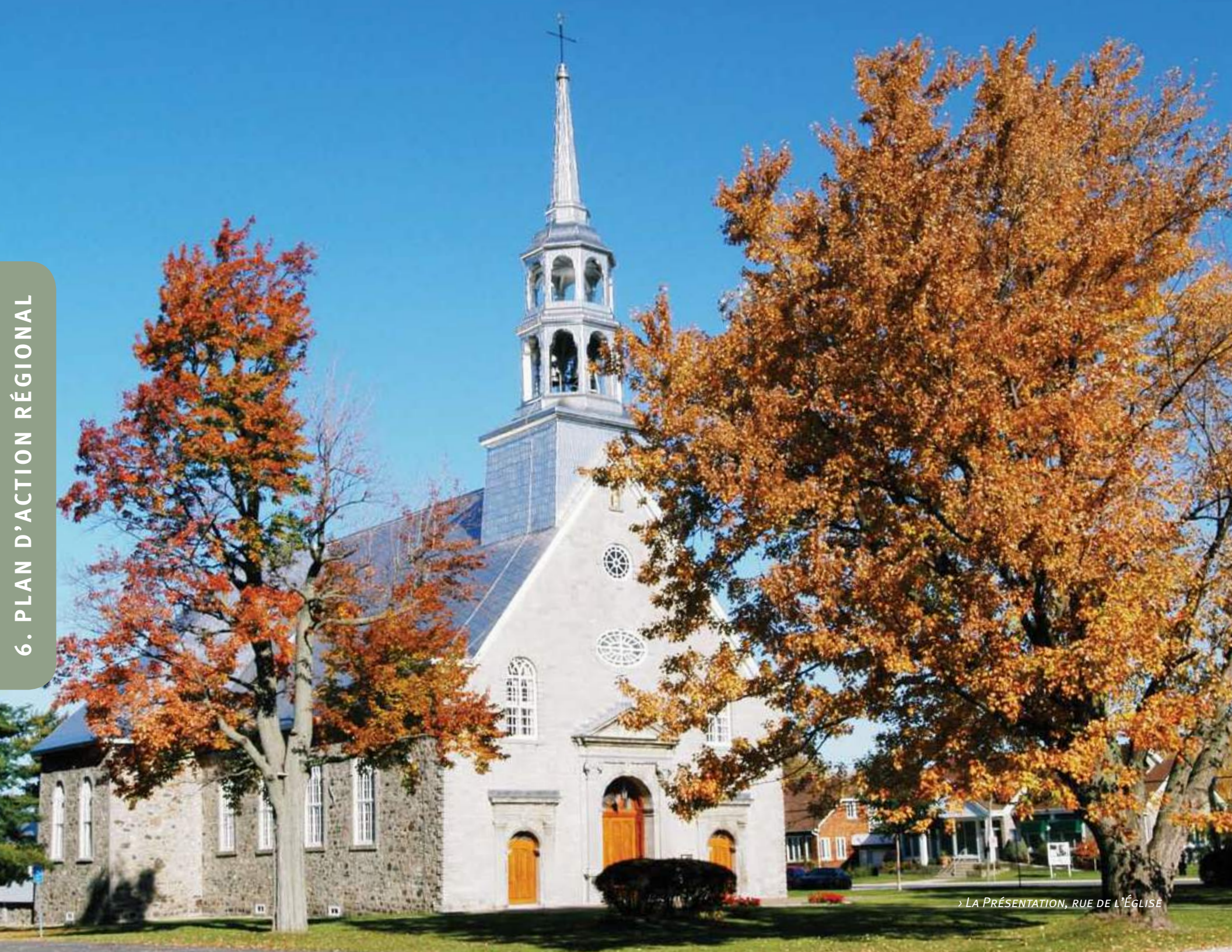
› LA PRÉSENTATION, RUE DE L'ÉGLISE