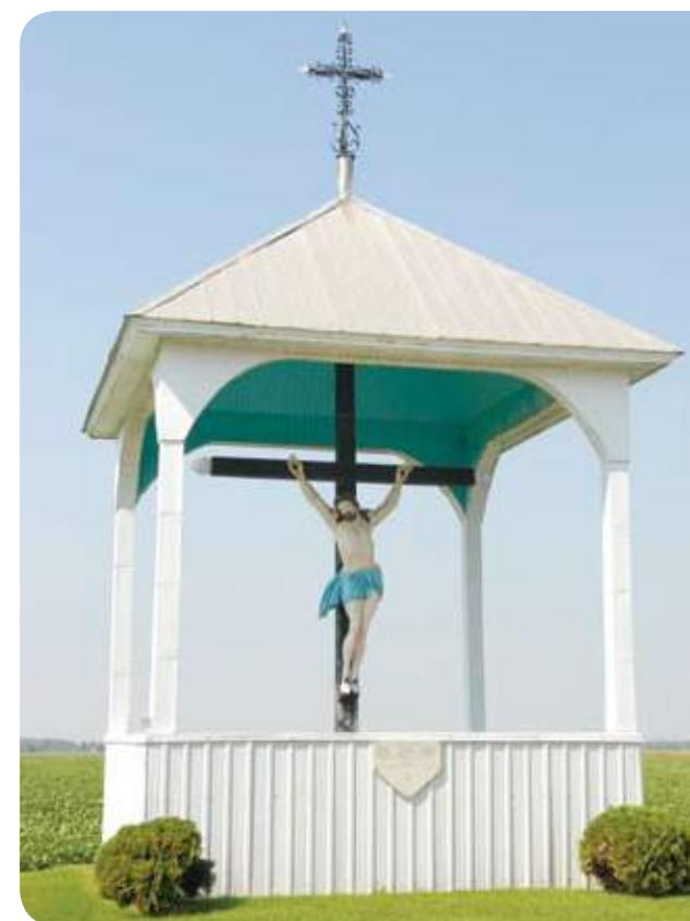
› SAINT-HYACINTHE, 2 E RANG

Source : Décret no 1193-2006 du 18 décembre 2006 remplaçant le décret no 1248-2005 du 14 décembre 2005. Gazette officielle du Québec, Partie 2, 17 janvier 2007, no 3.