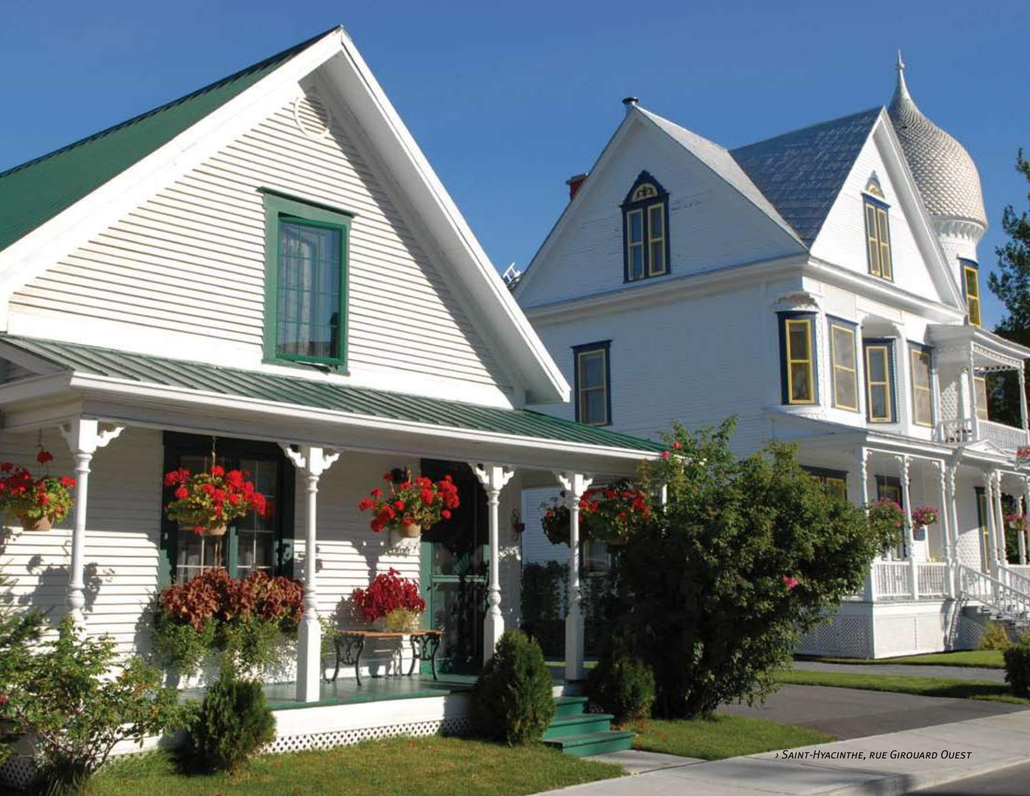
› SAINT-HYACINTHE, RUE GIROUARD OUEST