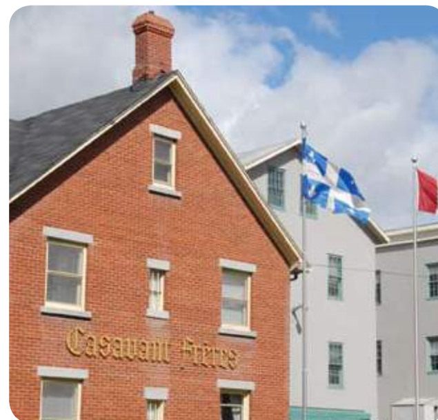
› SAINT-HYACINTHE, RUE GIROUARD EST

La MRC est consciente qu'un travail important reste à accomplir pour faire connaître, préserver et valoriser ce potentiel en grande partie inexploité qu'est le patrimoine.