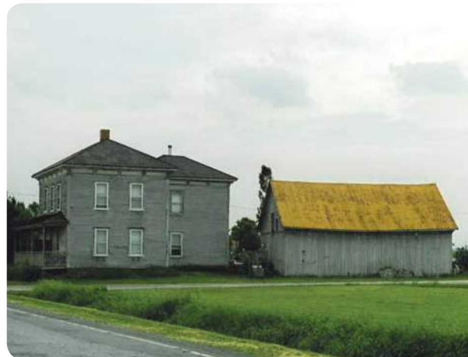
› SAINT-BARNABÉ SUD, RANG SAINT-AMABLE

Aujourd'hui au cœur d'une vaste région agricole, la ville-centre bénéficie du titre de «technopole agroalimentaire». Mentionnons également la présence d'un riche patrimoine architectural, de nombreux lieux d'enseignement centenaires, d'un passé industriel prospère, d'une rivière et d'un chemin de fer complices des lieux. En 2007, près de 52 000 citoyens aux histoires multiples forment ensemble «Saint-Hyacinthe la jolie».