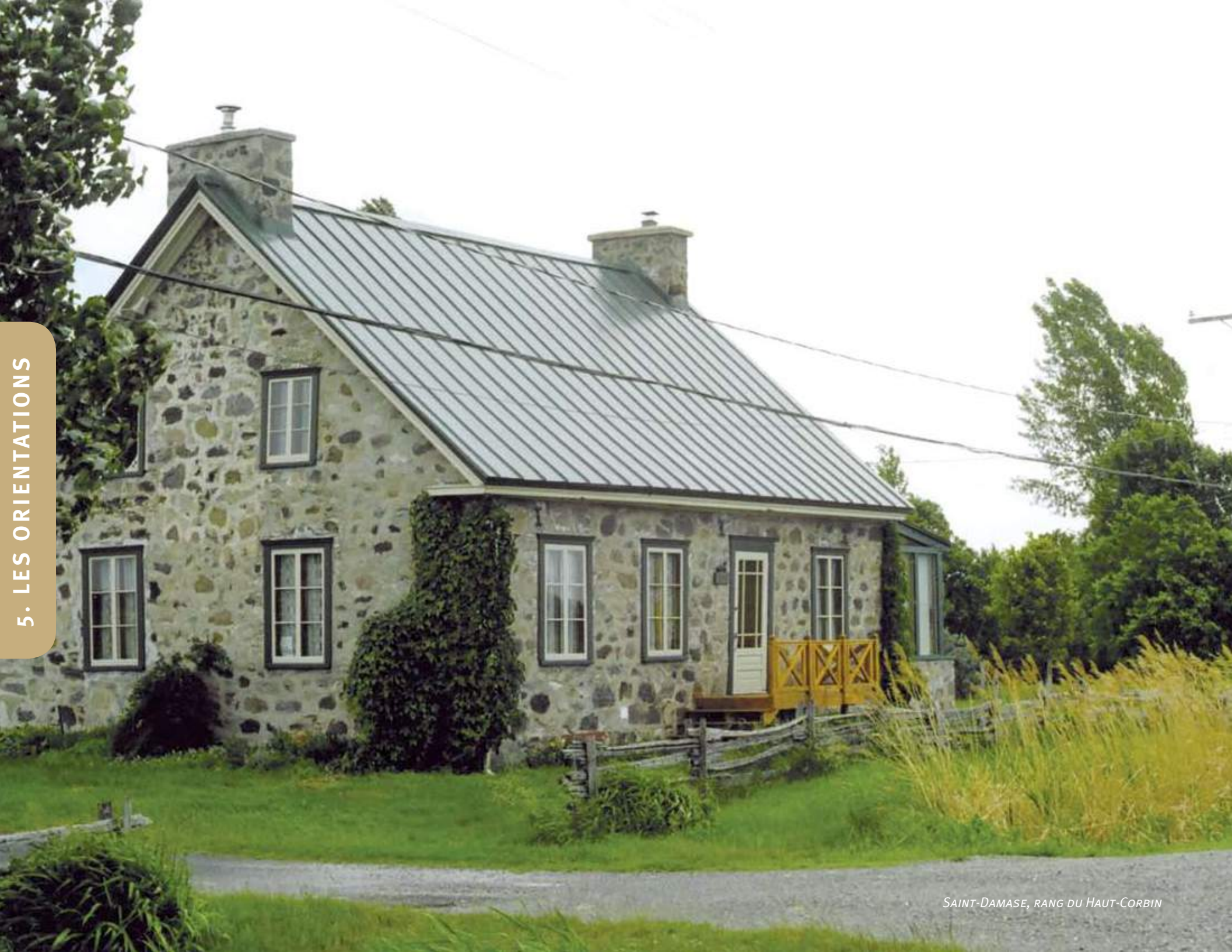
SAINT-DAMASE, RANG DU HAUT-CORBIN