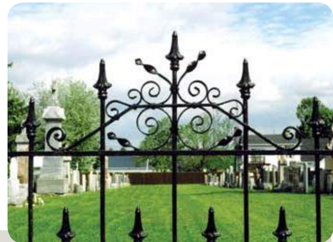
› SAINT-LIBOIRE, RUE SAINT-PATRICE

Pour toutes ces raisons, nous convions les citoyens de la Municipalité régionale de comté des Maskoutains à reconnaître, à protéger et à apprécier le patrimoine de notre région.