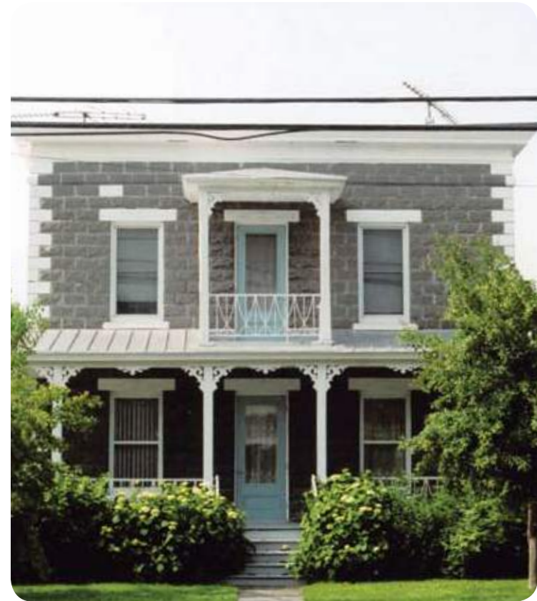
› SAINTE-MADELEINE, SAINTE-MARIE-MADELEINE, RUE DE L'HÔTEL-DE-VILLE

« Adopter son patrimoine » est une façon de développer des initiatives locales et régionales ou d'y participer pour que la transmission de la valeur du patrimoine puisse s'opérer. C'est pourquoi le patrimoine doit faire l'objet d'activités éducatives, de projets d'interprétation et de manifestations festives, afin que la population puisse saisir la valeur de ses propres racines.